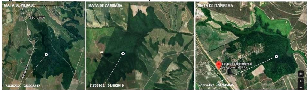
Figura 1- Matas de Piedade, Zambana e Itapirema, Pernambuco, Brasil